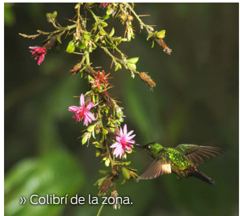
» Colibrí de la zona.

En este paradisíaco lugar se puede observar un paisaje natural formado por el caudal del río Blanco, donde existen especies de flora que se adaptan a las orillas de los ríos, como el Chiparo, una especie de árbol que se asimila al manglar. En un sector del recorrido todas las tardes se posan cientos de garzas buayeras ( Bubulcus ibis ) para su descanso y anidamiento por lo que se