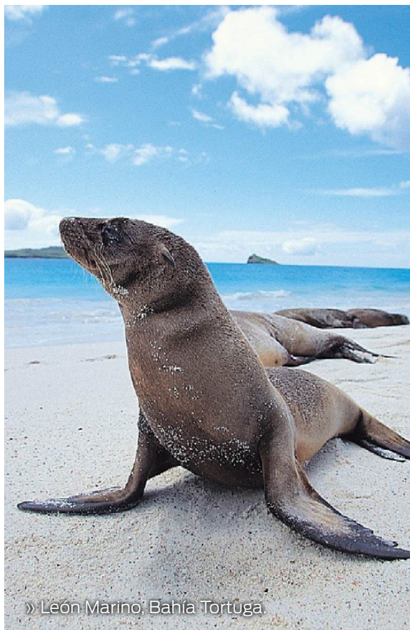
» León Marino, Bahía Tortuga

Las dunas de arena y una punta rocosa dividen la playa, creando un área protegida y buena para bañarse: "la playa mansa". Antes de llegar a la caseta de control, existe un parqueadero de bicicletas; una vez en la caseta, debe proceder a registrarse con el Guardaparque presente en dicho lugar.