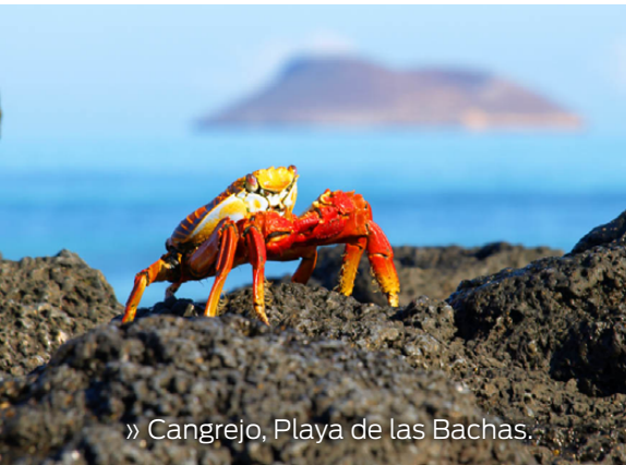
» Cangrejo, Playa de las Bachas.