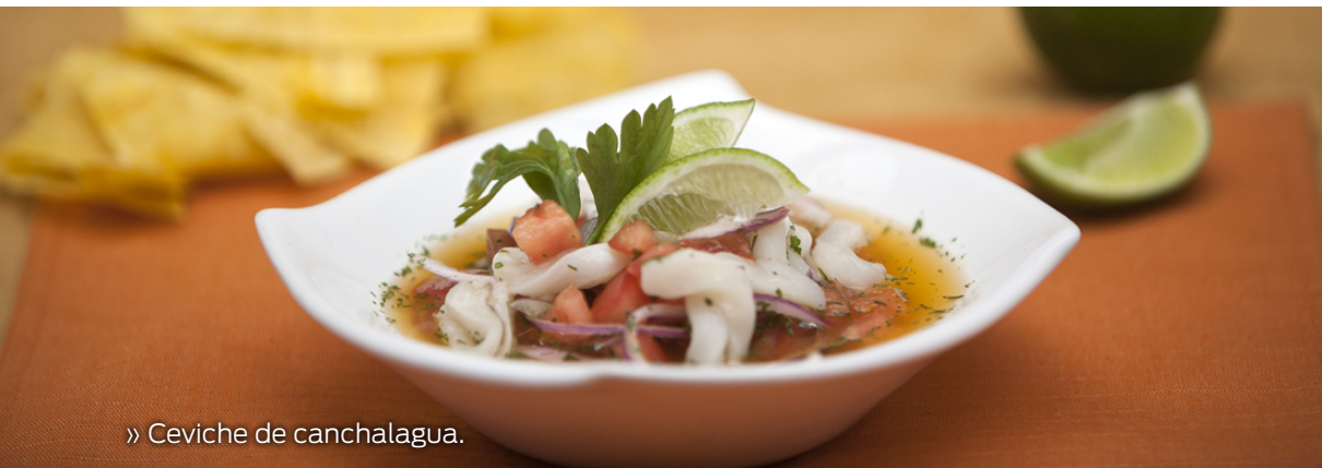
» Ceviche de canchalagua.

Este día tendrá una visión del mundo submarino de Galápagos. En primer lugar, en un paseo a lo largo de la costa en el bote para identificar aves costeras, como la fragata grande y el famoso piquero de patas azules. La embarcación fondeará en el canal Isla Lobos o Sea Lion Island, donde podrá ponerse sus aletas e ir en busca de peces damisela, pez globo, y, con suerte, curiosos cachorros de lobos marinos. Desde allí, continuará a Kicker Rock o León Dormido, como se le conoce por los lugareños, para explorar los restos finales de un cono de toba de 148