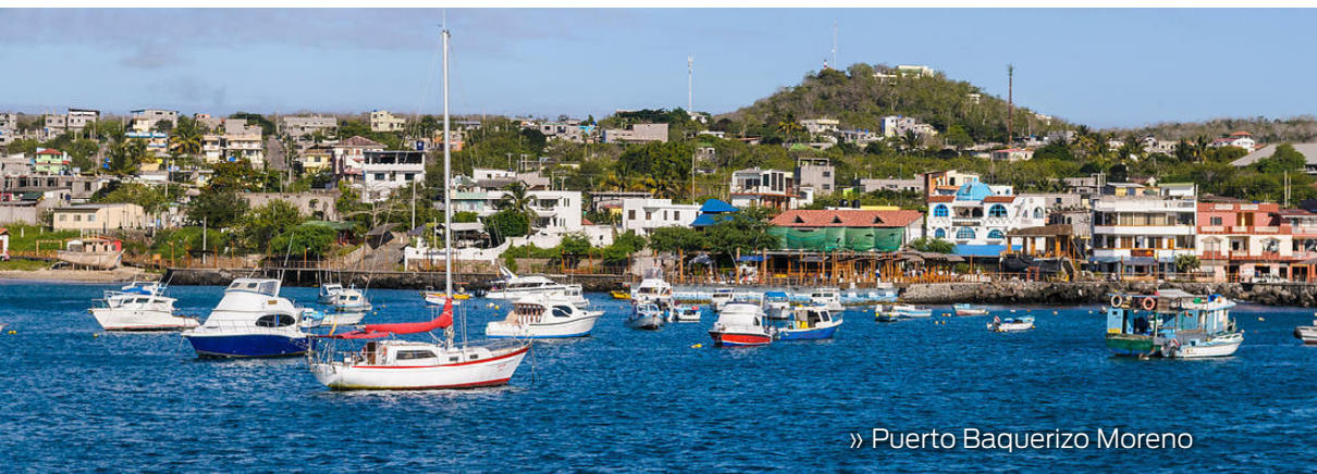
» Puerto Baquerizo Moreno