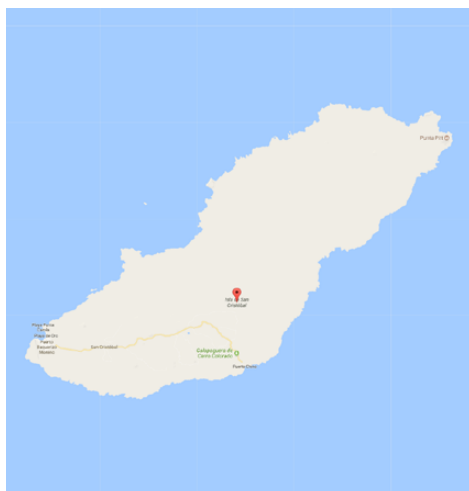
Mapa San Cristóbal