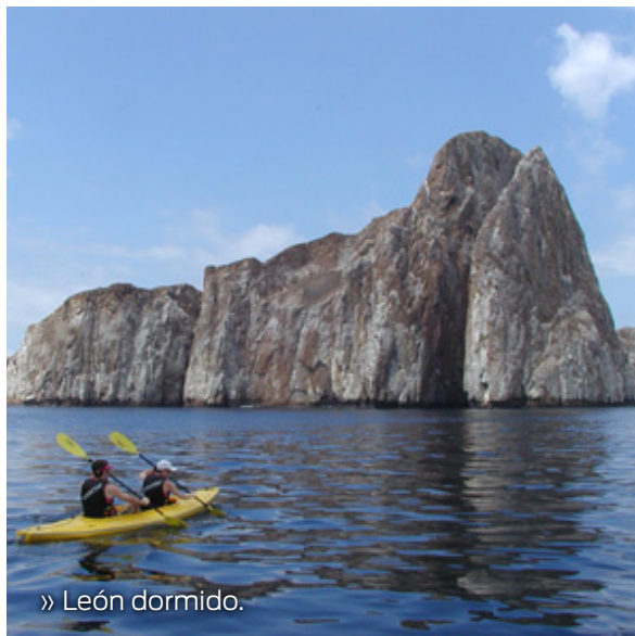
» León dormido.

Está ubicado a pocos kilómetros del Centro de Crianza junto al Cerro Colorado, al otro lado de Puerto Baquerizo Moreno. El acceso es vía terrestre hasta una mina de ripio, desde ese punto debe caminar un sendero de aproximadamente 1475 metros hasta llegar a su hermosa playa de arena blanca. El tiempo que toma visitar este sitio es de alrededor de cinco horas. La existencia de dos quebradas que desembocan en la playa hace que en temporadas de lluvias fuertes los sedimentos de arena blanca fluctúen a través del