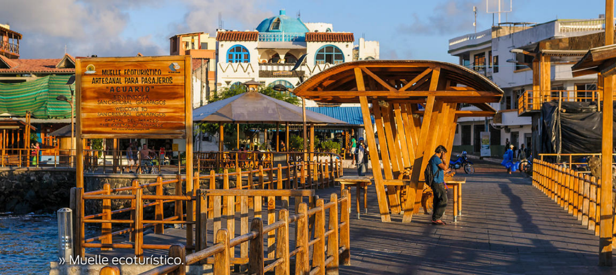
» Muelle ecoturístico.

año cambiando la extensión de la playa considerablemente. Aquí se puede realizar paisajismo, fotografía, observación de flora y fauna, natación, snorkeling, kayak, campamento previa autorización de la DPNG.