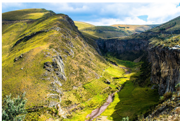
PARQUE NACIONAL CHIMBORAZO