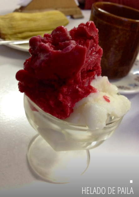
HELADO DE PAILA