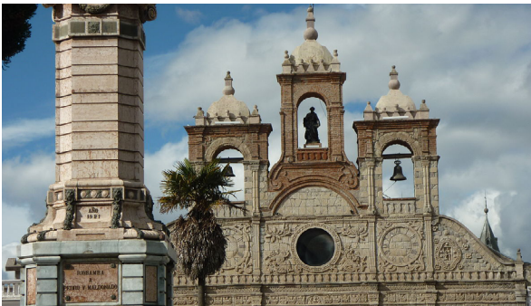
CATEDRAL DE SAN PEDRO

El núcleo histórico de Riobamba se encuentra compuesto de varias iglesias, parques, museos, santuarios y edificaciones coloniales los cuales se mezclan con calles empedradas.