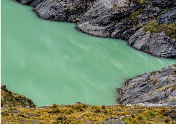
AGUAS DE LA LAGUNA AMARILLA

niveles. Sus paredes tienen una longitud de 2 km, y una altura desde 20 m hasta 100 m. En la parte sureste del cañón existe una hermosa cascada, donde se origina el río Chorrera.