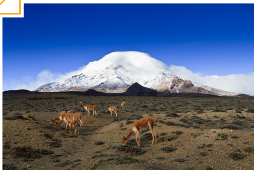
RESERVA DE PRODUCCIÓN DE FAUNA CHIMBORAZO