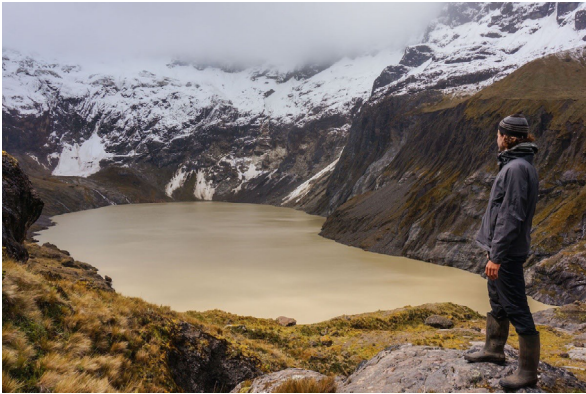
VOLCÁN "EL ALTAR"

Es un volcán inactivo cubierto por glaciares. Está formado de varios picos y enormes ágoras como resultado de su última erupción. Debido a su estructura natural, semejante al altar de una iglesia, sus cumbres llevan nombres eclesiásticos. Así, su cumbre más alta se llama "Obispo", y se ubica a 5.319 msnm. El Altar o Kapak Urku, que significa "El poderoso o el señor de las montañas", es considerado uno de los nevados más hermosos del Ecuador. Al interior del volcán, sus glaciares forman mágicas lagunas. Entre las más importantes tenemos: laguna Amarilla o Caldera, Azul, Verde, Pintada y Mandur, entre otras.