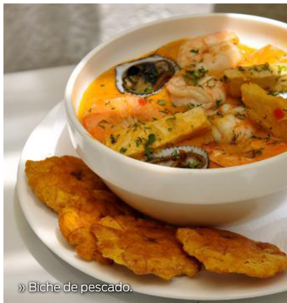
» Biche de pescado.

La Isla de la Plata está ubicada a 50 km de la costa de Puerto López. Es uno de los mayores atractivos del Parque Nacional Machalilla. Su característica principal está en la diversidad de aves que habitan en el lugar. Por su belleza escénica la Isla de la Plata se convierte en un lugar ideal para el ecoturismo. Posee una extensión de 1200 ha y desde 1979 el Parque Nacional Machalilla