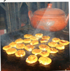
TORTILLAS DE MAÍZ

Penipe te espera con una gran variedad de frutas: manzanas, claudias, membrillos y más.