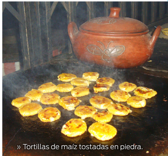
» Tortillas de maíz tostadas en piedra.