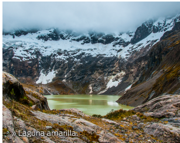
» Laguna amarilla.

Es de formación rocosa que baja por un riachuelo con apariencia de ojo; la caída de agua tiene una altura aproximada de 30 metros. En el entorno se puede observar un espectacular paisaje, tomar fotografías o realizar curaciones naturales.