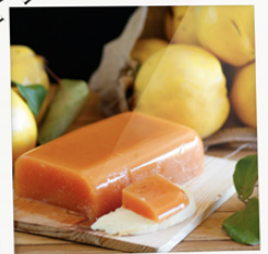
DULCE DE MEMBRILLO

Las cascadas del río Chambo te presentan escenarios naturales formados por la lava del Volcán Tungurahua. ¡Conócelas!