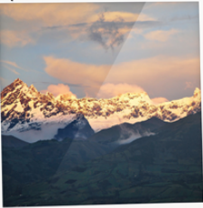
NEVADO EL ALTAR