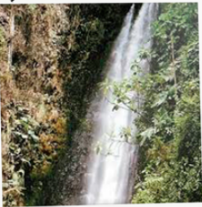
CASCADAS DEL RÍO TAMBO

Disfruta de una inolvidable experiencia en familia capturando tus mejores momentos fotográficos en la Laguna Amarilla.