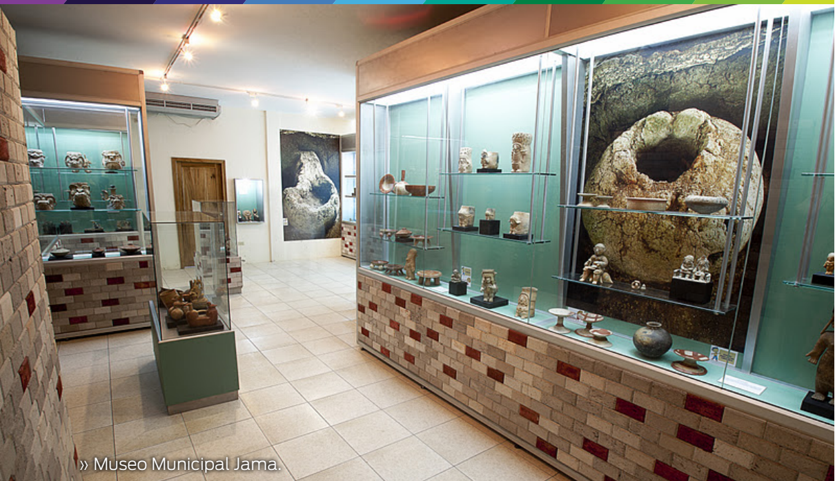
» Museo Municipal Jama.