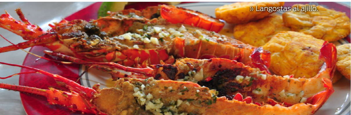
» Langostas al ajillo.