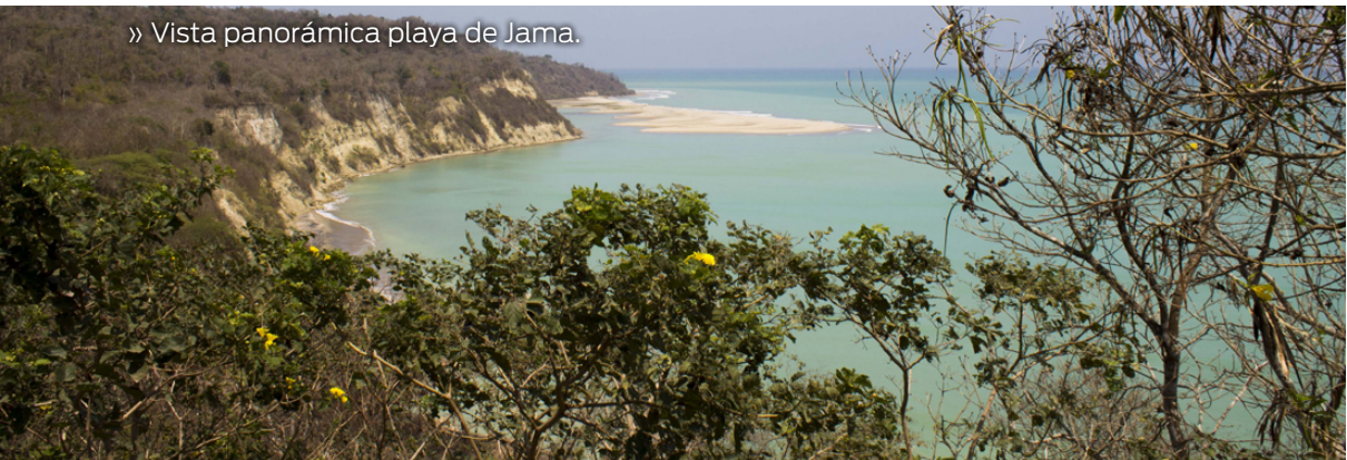
» Vista panorámica playa de Jama.