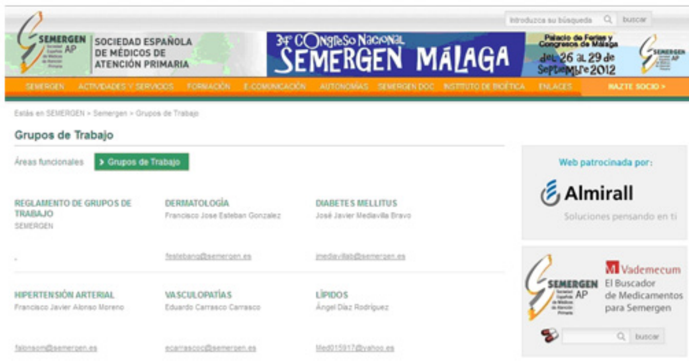
Imagen 3. Grupos de Trabajo de la Sociedad Española de Médicos de Atención Primaria.