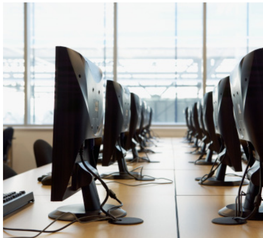
Cuadro N.º 1

Para el análisis de todos los discursos narrativos expuestos en los ocho grupos de discusión realizados, se contó con el apoyo tecnológico gracias al estudio de los datos recogidos, mediante el software del ATLAS.ti. Este es una herramienta informática aplicada en el análisis semántico de datos cualitativos de textos, facilitando las actividades en el análisis y la interpretación, al construir una red que permite conectar visualmente pasajes seleccionados, conceptos y teorías basadas en las relaciones visibles, así como descubrir significados interrelacionados. Un paso en la aplicación de ATLAS.ti, es la delimitación de los códigos semánticos que vertebran la red de significados y mapas conceptuales que diseña el programa. A continuación, se presentan los códigos semánticos más representativos en nuestra investigación, con su posterior desarrollo. Estas categorías se han diseñado en relación con los objetivos planteados, que se presentan en el siguiente cuadro: