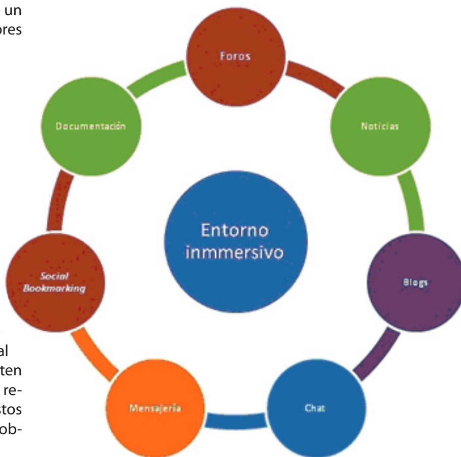
Imagen 4. Herramientas colaborativas en un entorno inmersivo

través de un buscador de palabras claves y etiquetas; y de nubes de etiquetas. Igualmente, es conveniente que puedan ser categorizados por palabras claves.