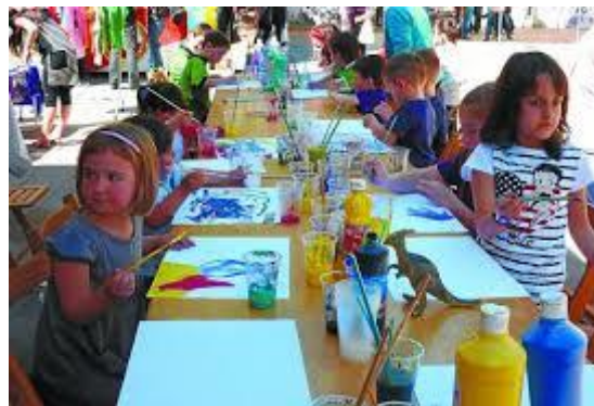
Imagen: artística. Tomado de: la pintura. Recuperado por https: https://goo.gl/m3kDLc

Existen tres lenguajes artísticos en un orden asociado a la cercanía que estos tienen con el cuerpo y con la manera en la que bebés, niñas y niños se van acercando y apropiándose de ellos. Teniendo en cuenta lo anterior, en primer lugar aparece el juego dramático, seguido de la expresión musical y por último se encuentra la expresión visual y plástica buscan inspirar y enriquecer el trabajo pedagógico de las maestras, los maestros y los agentes educativos de acuerdo con las características de las niñas y los niños.