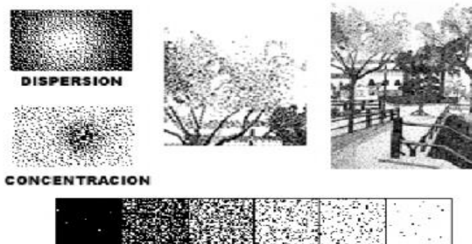
Imagen 8: punto

Cualquier punto genera una atención. Una multitud de puntos dispersos de forma variada o agrupada determinan gradaciones tonales, de manera que sugieren volúmenes, contornos, luces y sombras, mediante la situación de las zonas claras y oscuras, resultantes de la expansión y dispersión de puntos.