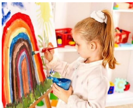
Imagen: artística. Tomado de: expresión artística. Recuperado por https://goo.gl/QEsYjX

La tarea de las educadoras/or es generar empatías, provocar procesos, conmover, incitar, avivar, sacudir, abandonar las rutinas. Cada actividad que se realice con los niños debe generar sorpresa, impresionar, cuestionar las convicciones y los estilos para ir incorporando como matrices de aprendizaje.