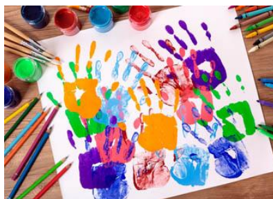
Imagen: artística. Tomado de: Tortosa Recuperado por https://goo.gl/czjTvF

La exploración sensorial permite a los niños plasmar obras de arte maravillosas expresando todo lo que les rodea en su entorno.