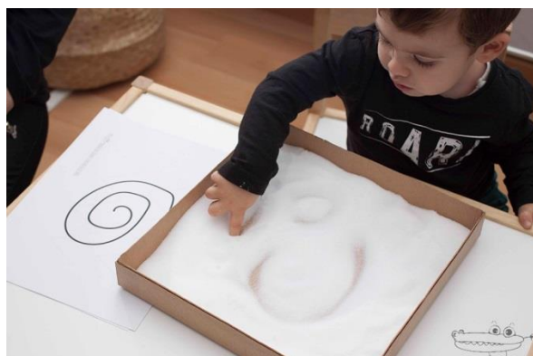
Imagen: línea. Tomado de: la pintura. Recuperado por https://goo.gl/m3kDLc

Diagonales: pueden crear un equilibrio de arriba-abajo y de derecha-izquierda. Se pueden utilizar solas o para crear diseños, formas tejados, velas, Otras líneas: curvas, zigzag, espirales.