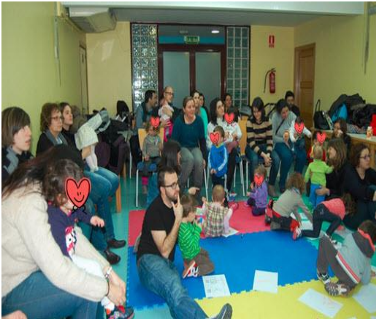
Talleres con padres