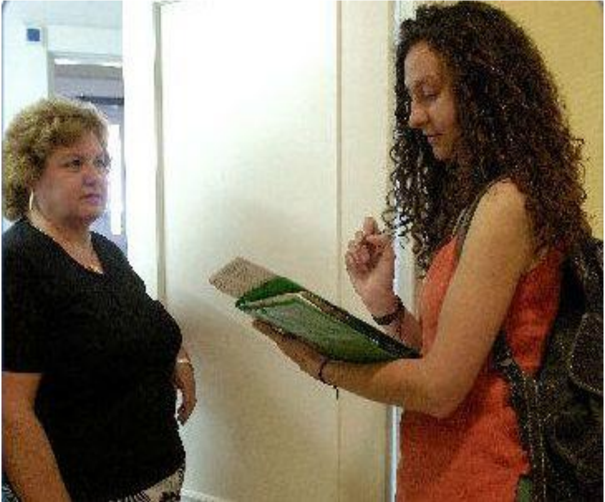
Investigación de campo sobre los tipos de familia