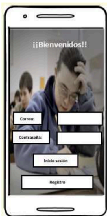
Figura 1. Registro y perfil

Aplicación móvil “Aprende con Amor” para facilitar el proceso de enseñanza-aprendizaje de la lectoescritura en personas con Síndrome de Down