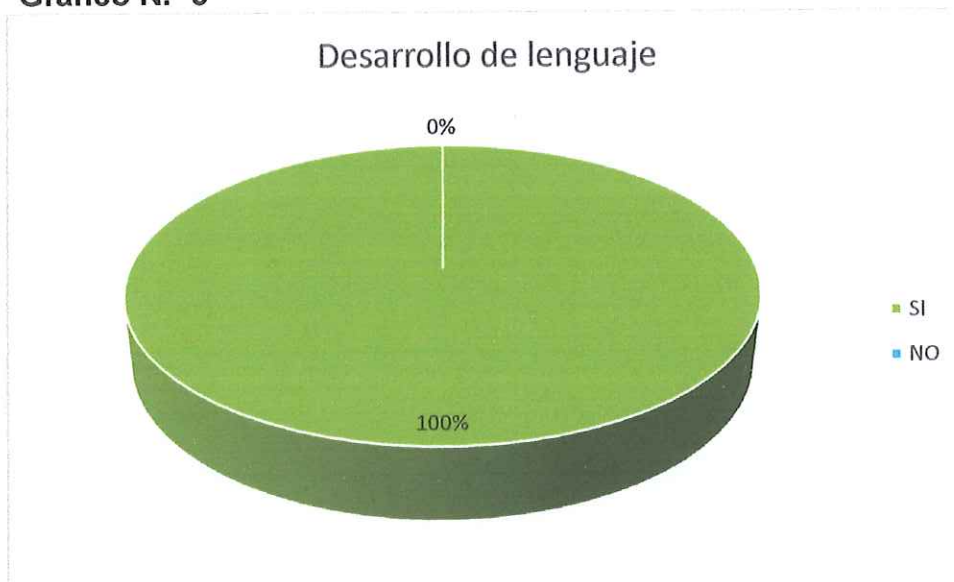
Gráfico N.- 5

6.- Con qué frecuencia utiliza usted las dramatizaciones en el aula de clases?