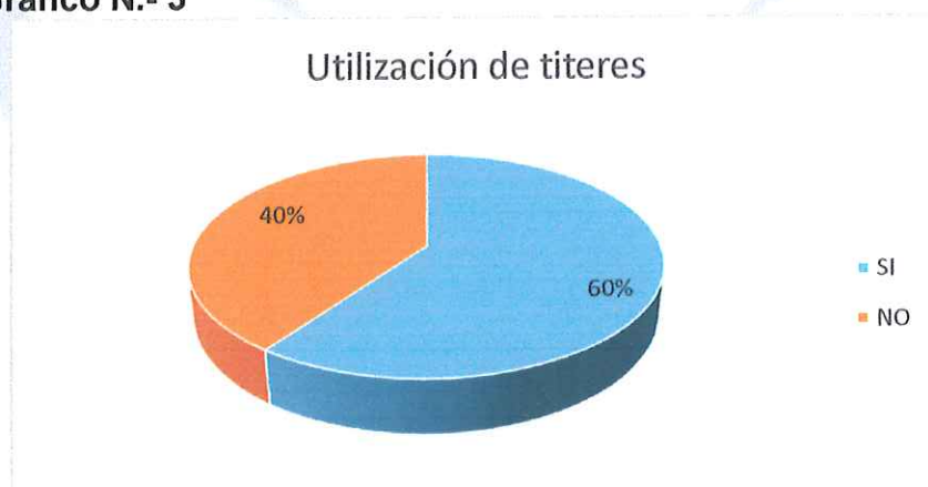
Gráfico N.- 3

4.- Cree usted que enseñar con títeres narraciones, dramatizaciones, cuentos, fabulas, trabalenguas, retahílas mejora el desarrollo del lenguaje en el niño.