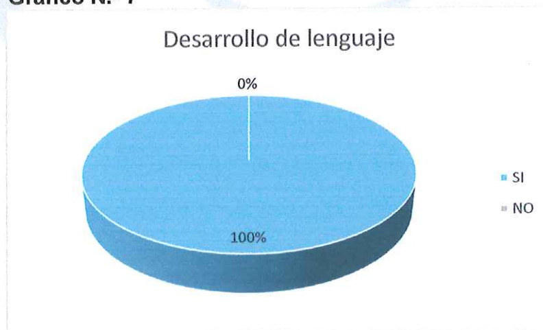
Gráfico N.- 7