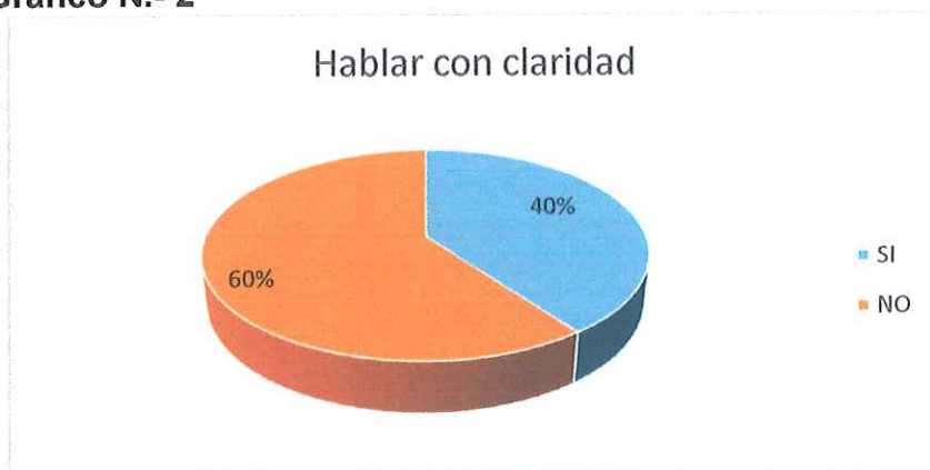
Gráfico N.- 2

3.- Considera conveniente la utilización de títeres para fortalecer la expresión oral?