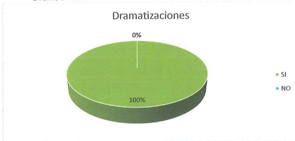
Gráfico N.- 6

7.- ¿Cree usted que, al utilizar la herramienta de una coreografía infantil, permite al niño a desarrollar el lenguaje?