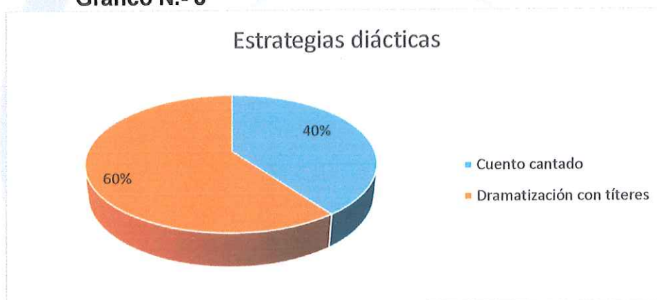
Gráfico N.- 8