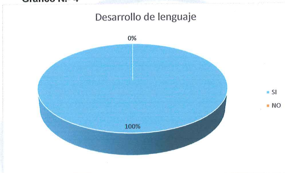
Gráfico N.- 4