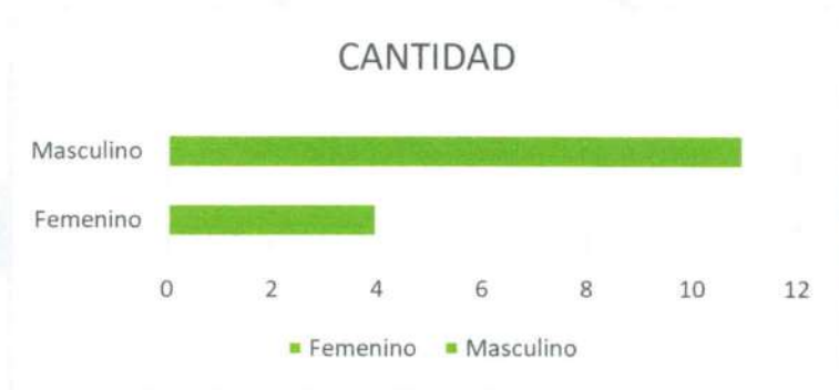
Gráfico 1 Sexo

Elaborado por: Estudiantes de 4to Administración