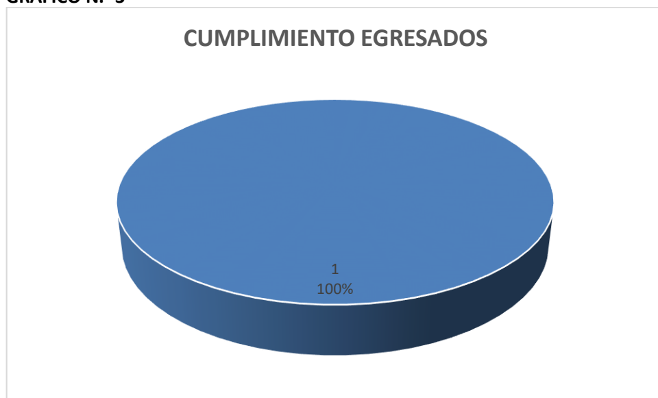
GRÁFICO N.- 3

Las personas egresadas deben haber realizado su proceso de vinculación con la sociedad.